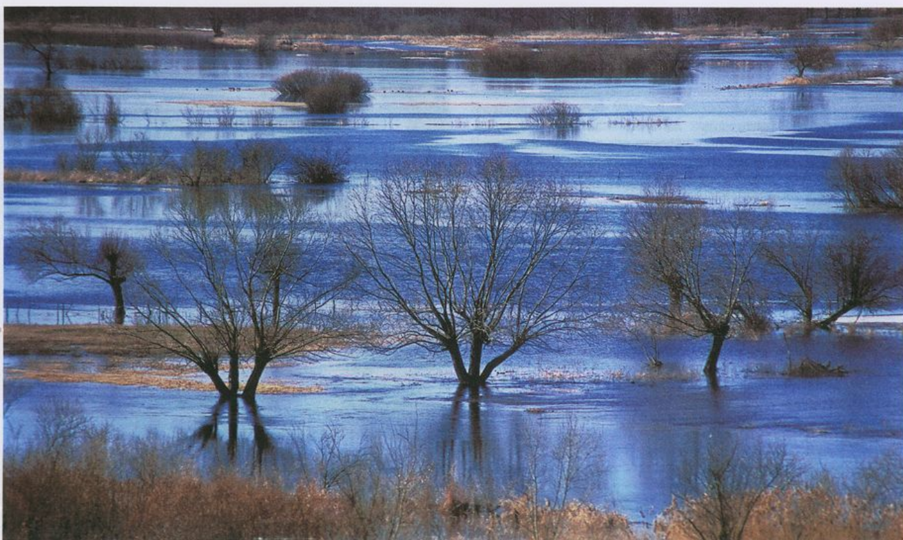
● Biebrza to rozlewiska po horyzont, z wyniesionymi ponad powierzchnię wody stogami i kępami drzew