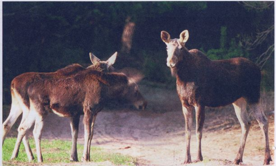
● Safari losiowe – zimą możemy podglądać zwierzęta z bardzo bliskich odległości

Jedyny okres, kiedy mamy gwarancję podglądania zwierząt z bardzo bliskich odległości: bobry, wydry, norki... Największą atrakcją jest safari losiowe. W opcji dla leniwych zwierzęta ogląda się wygodnie – z wnętrza ciepłego samochodu. Do osób zdecydowanie bardziej aktywnych kierowana jest wyprawa na legendarne Czerwone Bagno – tropienie w rewirze wilków. Tu, wędrując po wilczym terytorium, deptce się po piętach także innym, niekwestionowanym włodarzom tych terenów: losiom i rysiom.