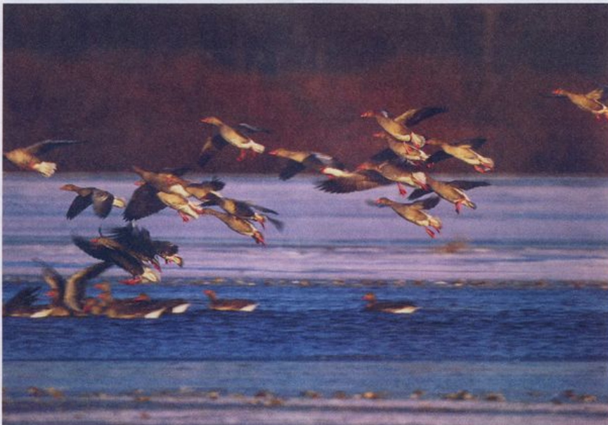
● Jesienią nad Biebrzą zatrzymują się ptaki w drodze na zimowiska